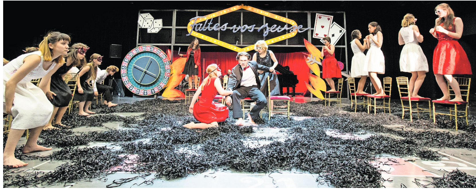
Leben oder Sterben? Hin- und hergerissen zwischen zwei Polen ist Faust. Sein Schicksal nimmt Mephisto (hinten) in die Hand.